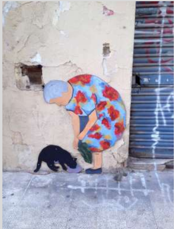
Onbekende kunstenaar (2015)

Wandelend op straat zagen ze dit schilderijtje de gore achterbuurt van een Spaanse stad opfleuren. Het échte FEEST zit in fijne momenten en kleine attenties.